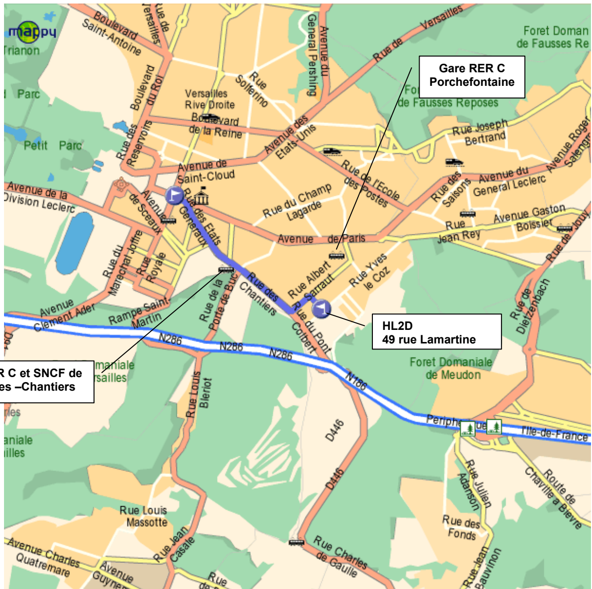
Plan avec emplacement des gares les plus proches