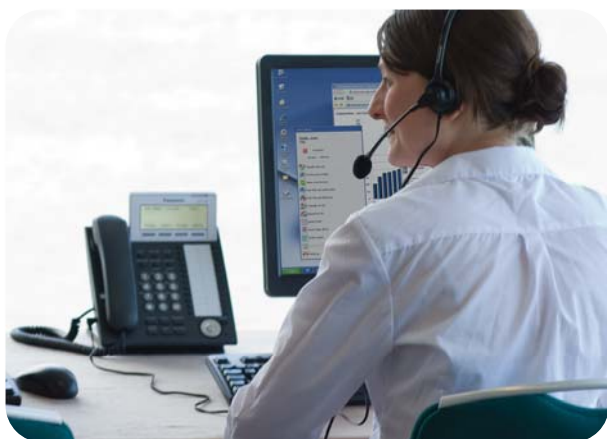
CA - VOTRE SOLUTION DE COMMUNICATIONS UNIFIÉES