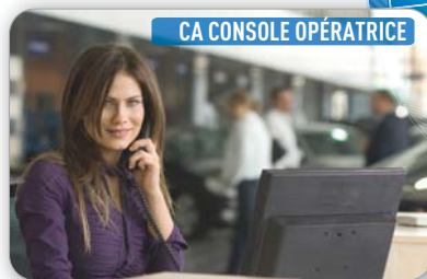
CA CONSOLE OPÉRATRICE