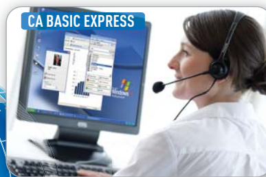
CA BASIC EXPRESS