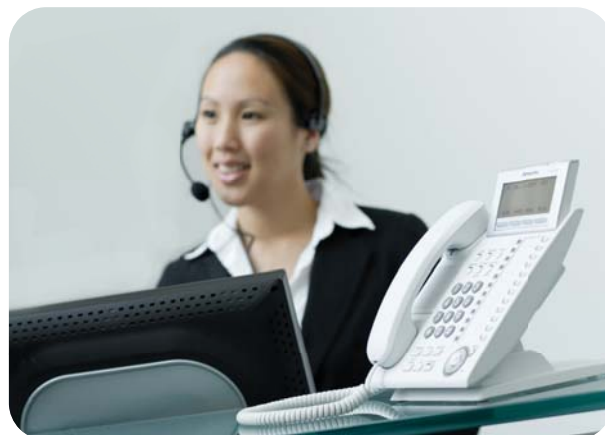
RÉCEPTIONNISTE UTILISANT COMMUNICATION ASSISTANT

La console opératrice offre aussi les options supplémentaires suivantes :